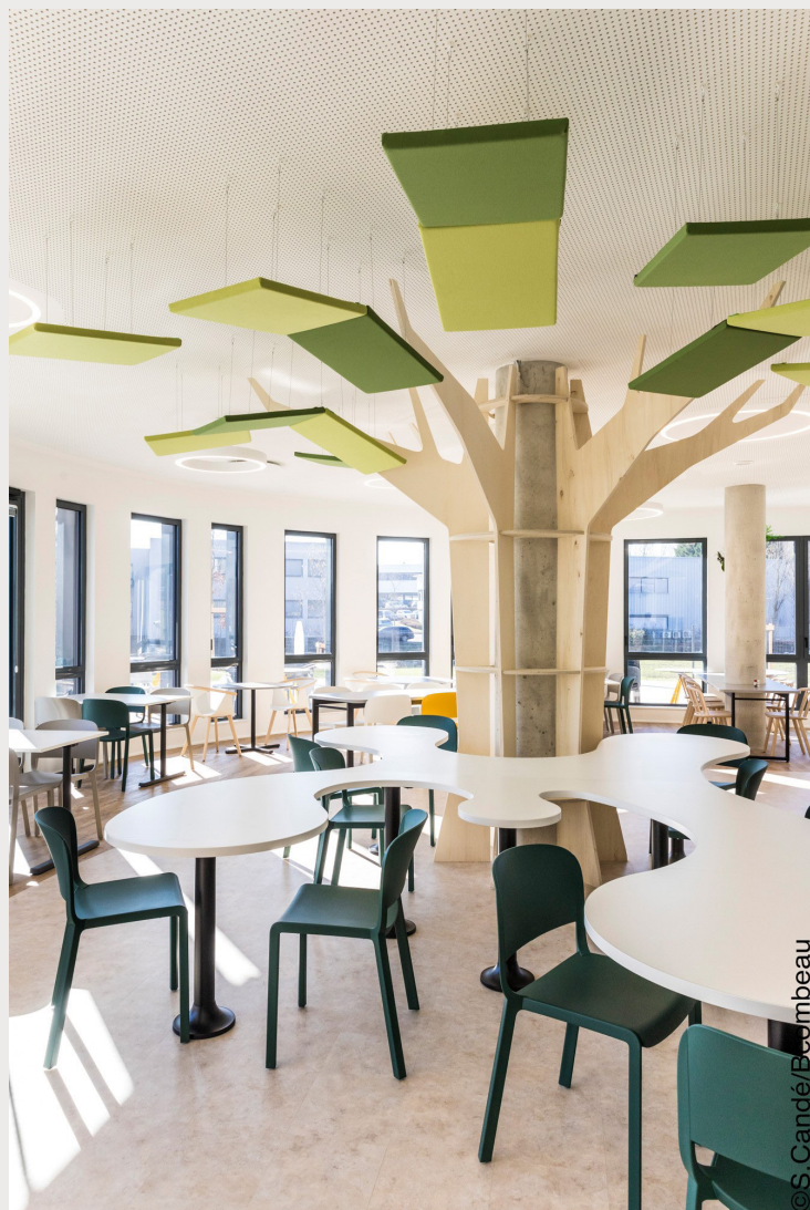
Siège de Danone à Limonest